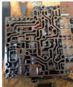
De DP0-bak is behalve bij veel Renault-modellen ook bij Peugeot en Citroën in gebruik. Vaak is na de reparatie een software-update nodig.