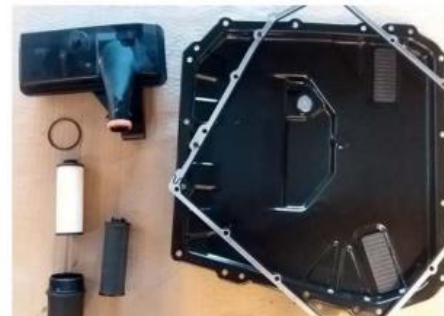
Jimmy Vanderpoorten: "Als er geen onderdelen leverbaar zijn via het dealernet, zoeken we een oplossing in de parallelmarkt."