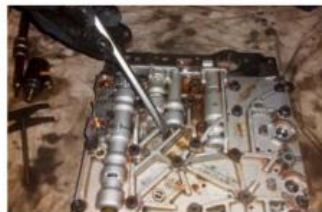
De ML-bak zat vol met slijpsel, waardoor de ventielen bleven hangen. Het is bij vooral jonge auto's vaak moeilijk om precies hetzelfde type tweedehands automaat te vinden. Hoe ouder de auto, des te meer aanbod van tweedehands bakken.