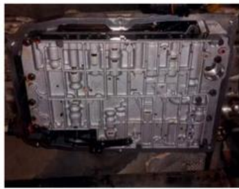
Bij Auto Verhaag in Leeuwarden kwam een snelle Mercedes-Benz ML binnen. De youngtimer had 380.000 km op de teller en kende schakelproblemen.