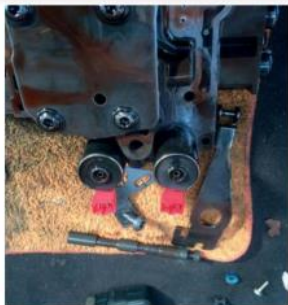
De klant zag een foutmelding op het dashboard. Henk Moesker ontdekte dat de schakelproblemen veroorzaakt werden door de solenoïds. Henk heeft ze vervangen.